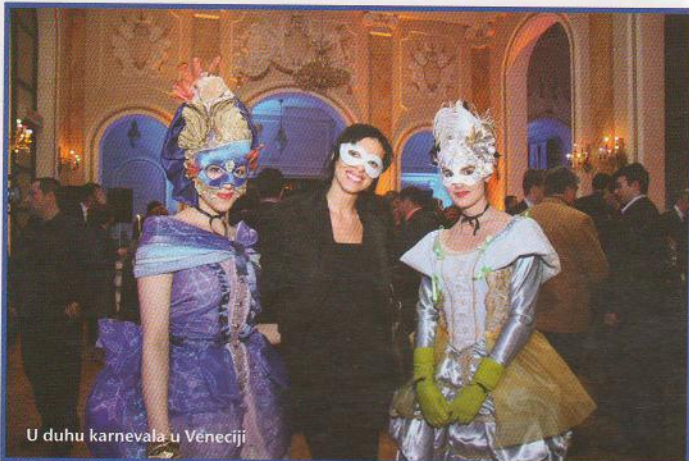
U duhu karnevala u Veneciji